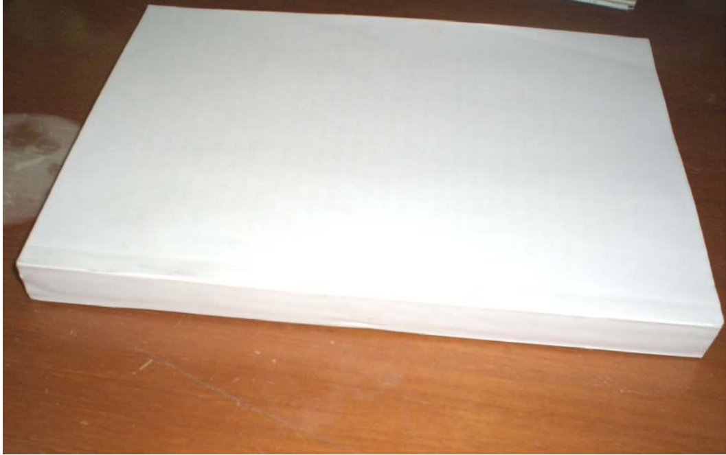
(注：上图为正确的封底格式)